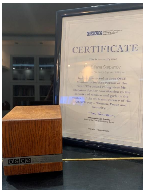
Slika 1: Nagrada OEBS-a

Ova nagrada odaje priznanje građanima Srbije koji su doprineli promociji vrednosti za koje se OEBS zalaže u zemlji – za nediskriminacija, zalaganje za ljudska prava, jednake mogućnosti i održive demokratske reforme, sa fokusom na poboljšanje života pojedinaca i zajednica.