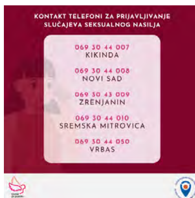
KAROSSEL OBJAVA: DESETOMESEČNA STATISTIKA ZA CENTRE ZA ŽRTVE SEKSUALNOG NASILJA